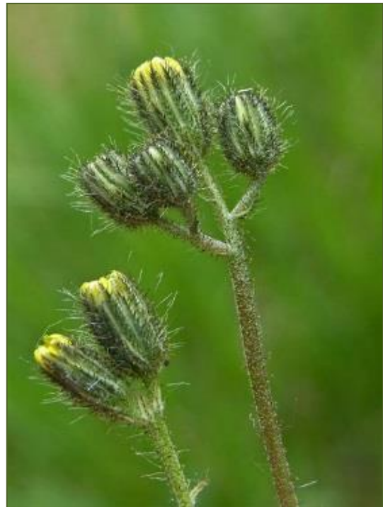
Spits havikskruid

Op de nieuwe vindplaats op de Lonnekerberg groeit de subspecies magnauricula , een ondersoort die zich onderscheidt van de typische vorm (subsp. typicum ) door de krachtiger bouw, met bloeistengels tot 40 cm lang, 2- tot 4-koppige bloeiwijzen en lang behaarde omwindsels. Deze ondersoort heeft zijn hoofdverspreiding in Oost-Europa en is voor zover bekend slechts een keer eerder aangetroffen in Nederland, bij Apeldoorn (1888)