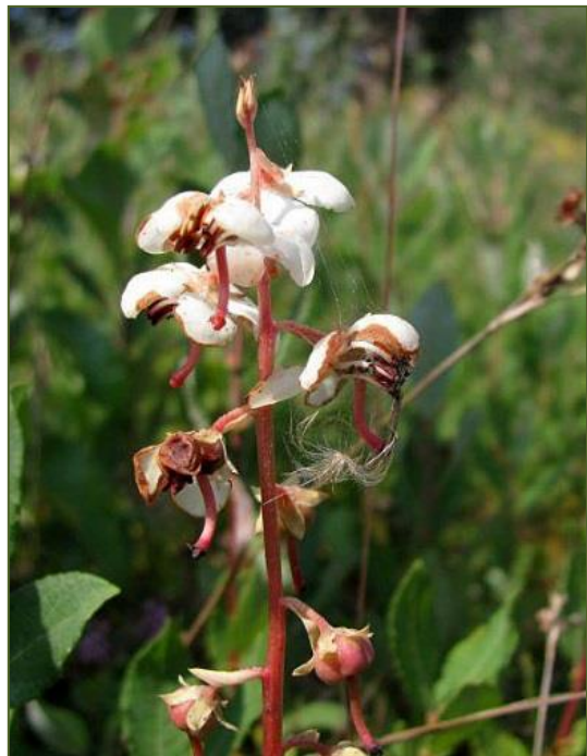
Rond wintergroen