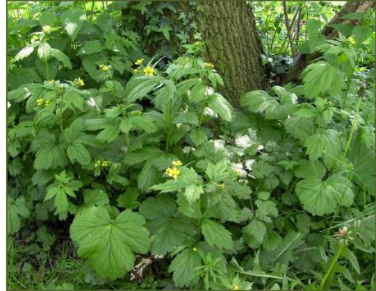
Groot nagelkruid