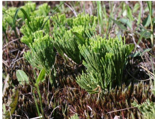
Kleine wolfsklauw

In dit deel van Twente alleen bekend van vondsten van voor 1950. In Noordoost-Twente is de soort in de jaren tachtig van de vorige eeuw verdwenen op de laatst bekende groeiplaats, de Paardenslenkte bij Vasse (med. Geert Euverman). Zie ook artikel in dit nummer. N van Hellendoorn (228-493), Rhaan (Johan Alferink)