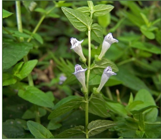
Scutellaria x hybrida