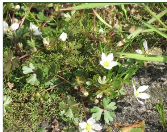
Ranunculus ololeucos

255-462 Enschede, Broekheurne (Jo Schunselaar)