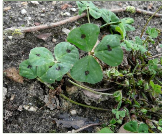
Medicago arabica

247-478 Hengelo, Woolde (Gijs Haverkamp)