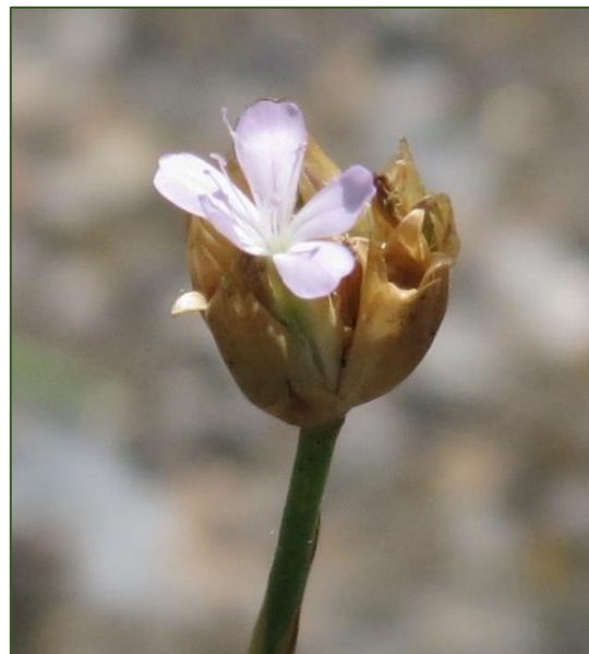
Petrorhagia prolifera (foto PIETER STOLWIJK)

256-473 Enschede, Handellaan, oprit carport (Pieter Stolwijk)