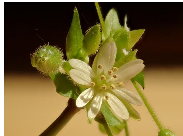
Foto 14 Heggenvogelmuur