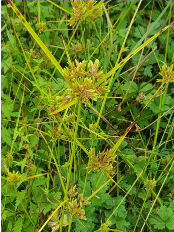
Foto 4 Bleek cypergras