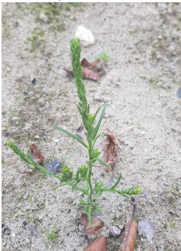
Foto 2 Smal vlieszaad