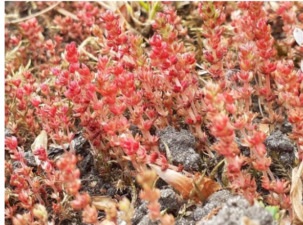
Foto 3 Mosbloempje