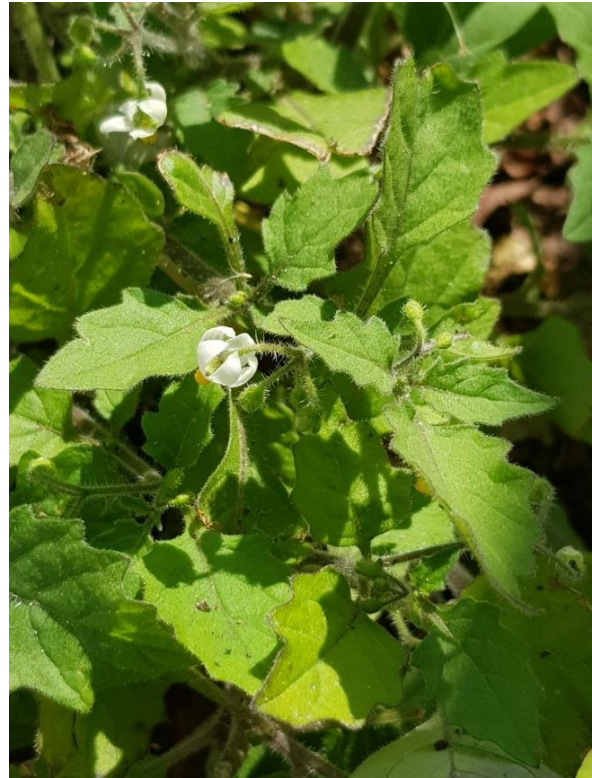
Foto 13 Kleverige nachtschade