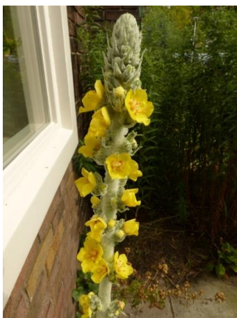
Foto 15 Vlokkige toorts