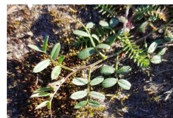
Foto 16 Lathyruswikke