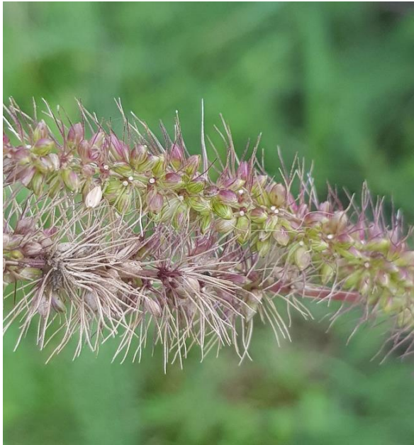
Foto 12 Gladde kransnaalbaar