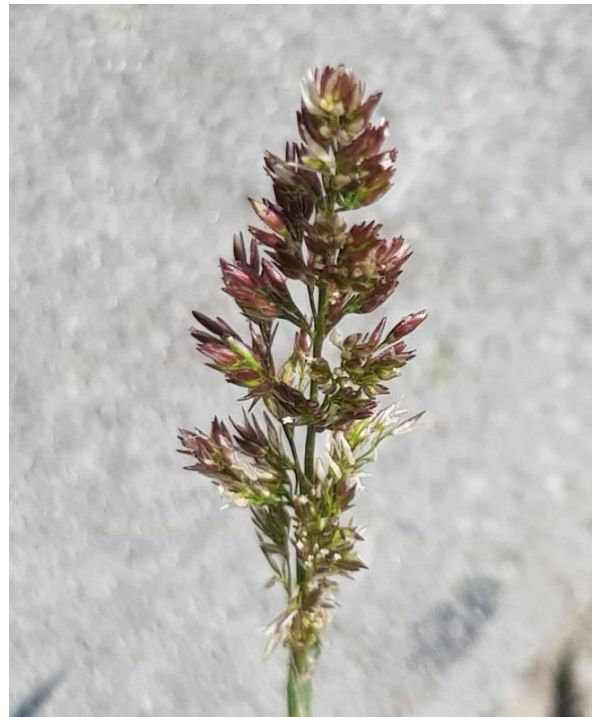
Foto 11 Kransgras