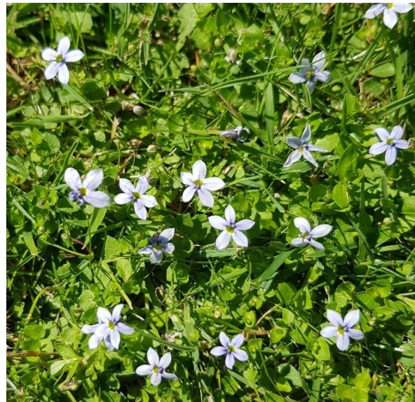
Foto 8 Gazonlobelia