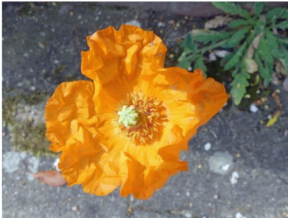
Foto 10 Donzige klaproos