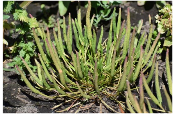
Foto 9 Muizenstaart