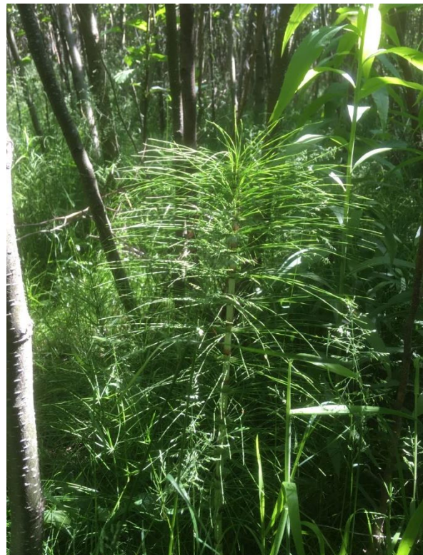
Foto 5 Reuzenpaardenstaart